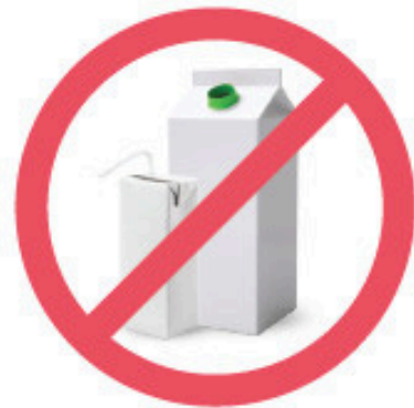
Cartons de jus et de lait (2027)