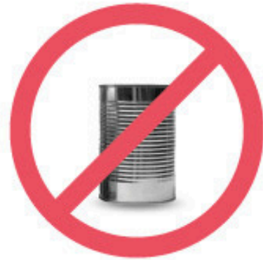
Boîte de conserve