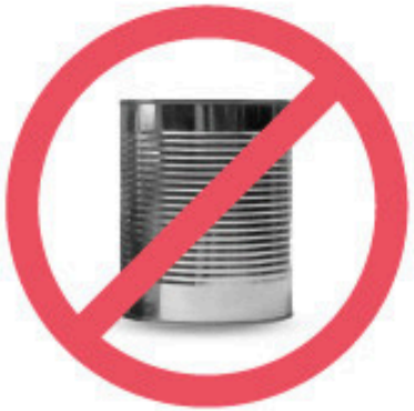
Jus en conserve de format familial