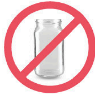
Contenant de condiments