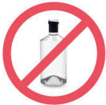
Spiritueux en verre (2027)