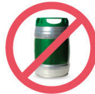
Baril de bière de 5 l