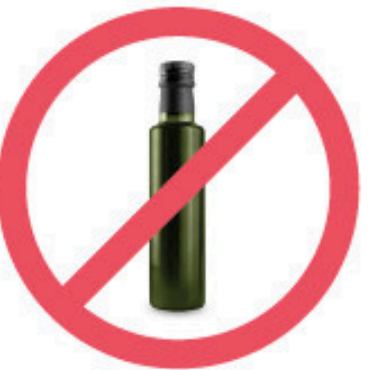
Bouteille d'huile végétale