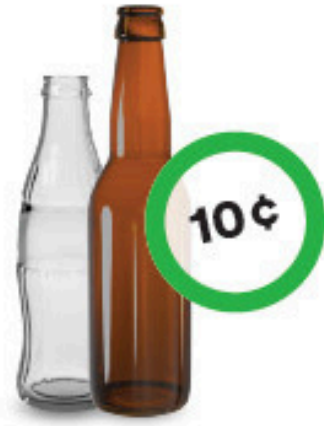
Bouteilles de boisson gazeuse et de bière en verre