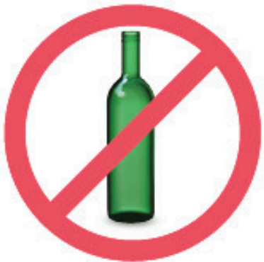
Bouteille de vin en verre (2027)