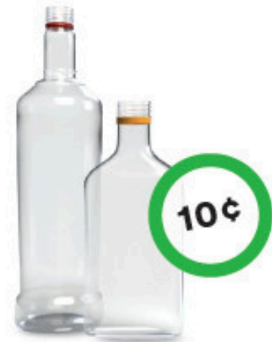
Bouteilles de spiritueux en plastique