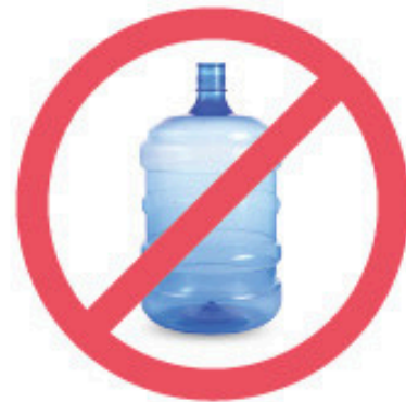
Cruche d'eau de 18 l (Consigne privée)