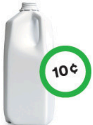
Bouteille de lait en plastique