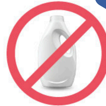
Contenant de détergent