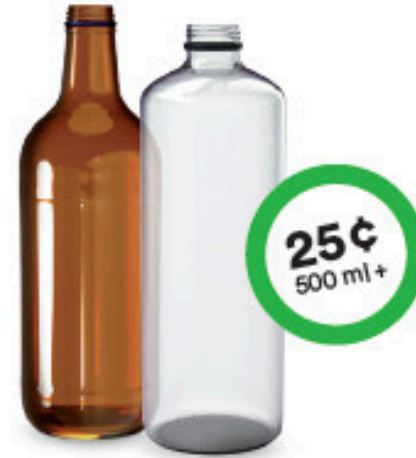
Bouteilles de bière et de boisson gazeuse en verre