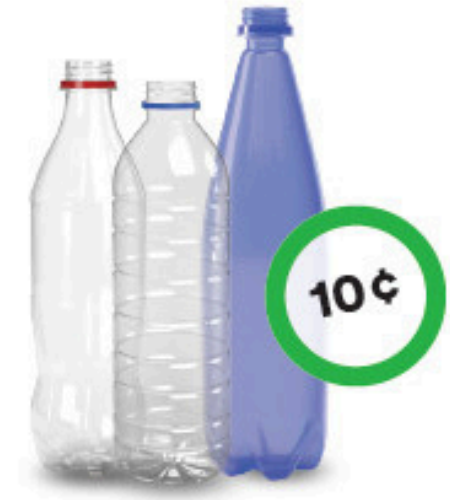
Bouteilles de boisson gazeuse, d'eau et d'eau pétillante en plastique