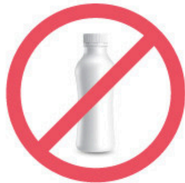
Contenant de yogourt à boire en plastique