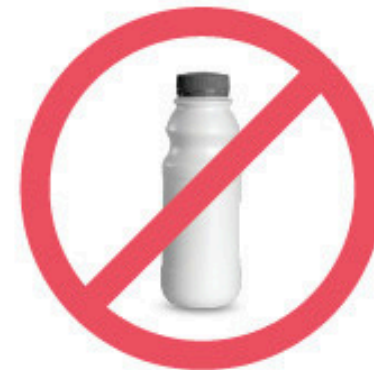
Contenant de boisson nutritionnelle en plastique