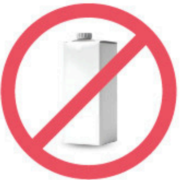
Contenant de bouillon de poulet