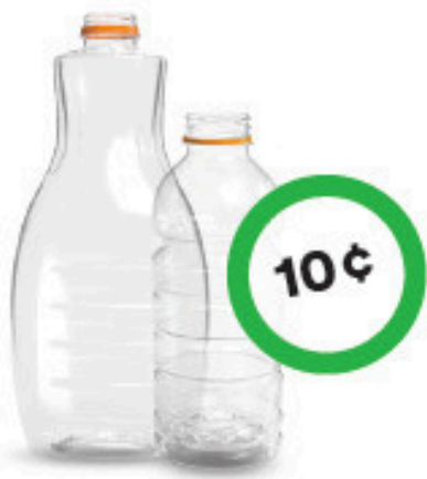
Bouteilles de jus en plastique